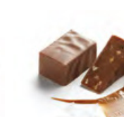
CRISTAL 水晶 果仁朱古力 - 榛子顆粒與莫爾登海鹽