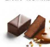
ANASTASIA 阿納斯塔西亞 果仁黑朱古力 - 緯度佳榛子蓉