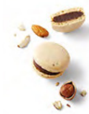
FIGARO 榛子黑朱古力 黑朱古力蓉，配以杏仁榛子果仁朱古力及榛子醬