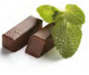
ZAGORA 扎戈拉 黑朱古力蓉 - 鮮薄荷葉浸香