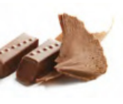
SYLVIA 蕭妃姬 牛奶朱古力蓉