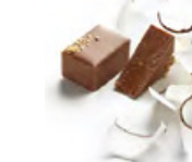
PALMIRA 帕米娜 果仁牛奶朱古力 - 焙香椰子蓉