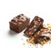
ROCHER NOIR ET LAIT 黑金沙 或 奶金沙 杏仁榛子果仁黑或牛奶朱古力 - 焙香杏仁顆粒