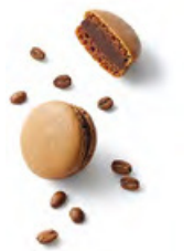
ABYSSINIE 咖啡黑朱古力 黑朱古力蓉，以滴漏咖啡浸香再以馬斯卡彭芝士提升味道