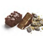
PRALINE GRAINE DE COURGE 南瓜籽脆片 南瓜籽果仁糖佐烤南瓜籽脆片