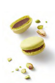
PISTACHIO 開心果黑朱古力 開心果醬朱古力