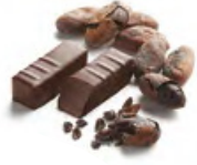
EXTRÊME CHOCOLAT 極品朱古力 純黑朱古力蓉 - 純可可的酸味與苦澀味的完美平衡