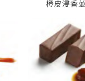
BACCHUS 酒神 黑朱古力蓉 - 火焰秣酒提子乾