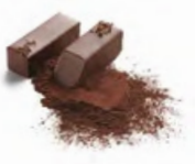
AKOSOMBO 阿科松博 純黑朱古力蓉 - 加納可可豆配香料