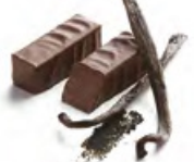
GUAYAQUIL 瓜亞基爾 黑朱古力蓉 - 波邦香草