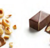
PRALINÉ NOISETTE 露斯亞 榛子果仁朱古力，內含香脆榛子顆粒