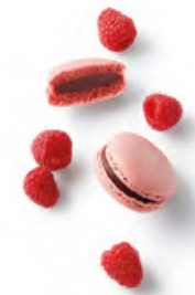
SALVADOR 紅桑子黑朱古力 紅桑子朱古力蓉