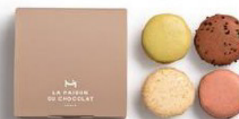
金裝馬卡龍小圓餅4件