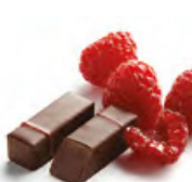
SALVADOR 薩爾瓦多 純黑朱古力蓉 - 紅桑子