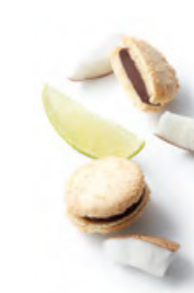
MACAPUNO 椰子青檸黑朱古力 椰子及青檸黑朱古力蓉，外層加入香烤椰絲