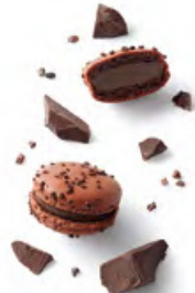
VENEZUELA 純黑朱古力 純黑朱古力蓉帶微酸花香，外層裹以香脆朱古力碎