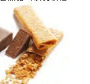
GRAIN DENTELLE 登堤爾 果仁牛奶朱古力 - 薄脆煎餅