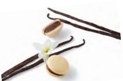
GUAYAQUIL 香草黑朱古力 黑朱古力蓉，波邦香草浸香