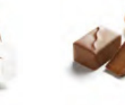
FIGARO LAIT 奶費加羅 果仁牛奶朱古力 - 杏仁榛子蓉