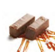
CARAMELO 焦糖 牛奶朱古力蓉配以香甜幼滑焦糖