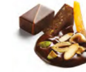
MENDIANT 果仁乾果 杏仁果仁黑朱古力，香烤榛子、開心果及糖漬橙皮