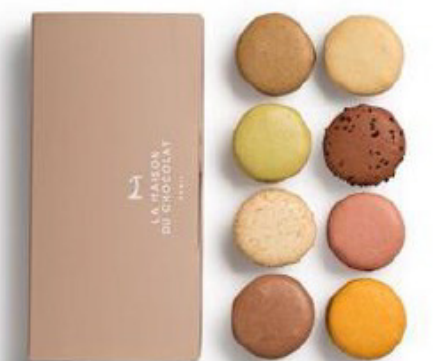
金裝馬卡龍小圓餅8件