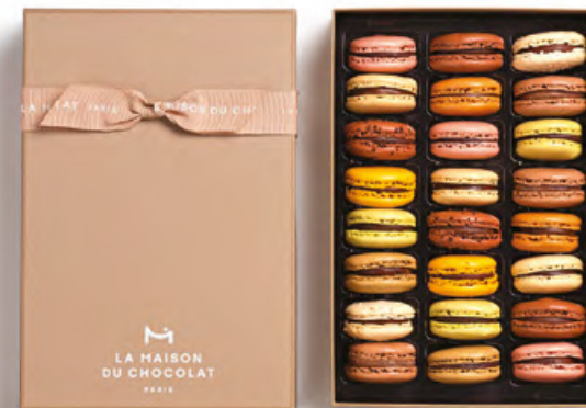
馬卡龍小圓餅禮盒24件

當朱古力蓉夾在絲滑的馬卡龍殼中，其馬卡龍殼顏色突出，薄脆外皮，內側口感綿密，完美體現美食的平衡。