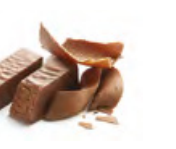
BOHÈME 波希米亞 軟滑牛奶朱古力蓉