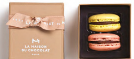
馬卡龍小圓餅禮盒2件