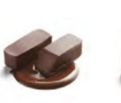
QUITO 基多 純黑朱古力蓉 - 苦甜醇香