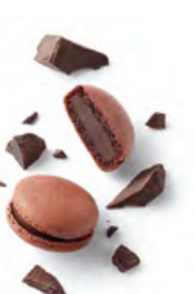
QUITO 濃厚黑朱古力 櫻桃酒浸原顆莫利洛黑櫻桃，純黑朱古力外層

La Maison du Chocolat 的馬卡龍小圓餅有著獨特的食譜。馬卡龍小圓餅有十一款口味，香甜的蛋白杏仁餅加入天然色素，塑造了誘人的粉色外觀。兩片精緻且滿載杏仁香的小圓餅加上絲般幼滑的朱古力蓉，配以不同的細緻味道，盡顯法式甜點的韻味。