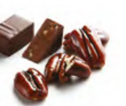
CARYA 山核桃 果仁牛奶朱古力 - 焙香焦糖山核桃顆粒