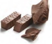
CARACAS 卡拉斯 純黑朱古力蓉 - 香濃醇味