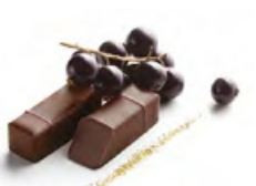
NOIR DE CASSIS 黑加侖子 黑朱古力蓉 - 勃根第黑加侖子