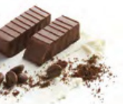
ABYSSINIE 阿比西尼亞 黑朱古力蓉 - 索比亞研磨咖啡以冷凍技術浸香