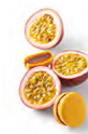
MARACUJA 熱情果黑朱古力 熱情果純黑朱古力蓉