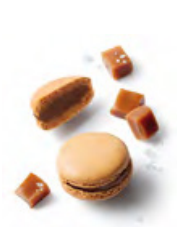
RIGOLETTO 焦糖黑朱古力 特製焦糖朱古力蓉，香濃帶輕微咸香