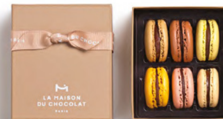
馬卡龍小圓餅禮盒6件