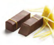
ANDALOUSIE 安達盧西亞 黑朱古力蓉 - 檸檬皮及檸檬忌廉