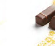
CHIBERTA 俏葩塔 黑朱古力蓉 - 橙皮浸香並混合香橙忌廉