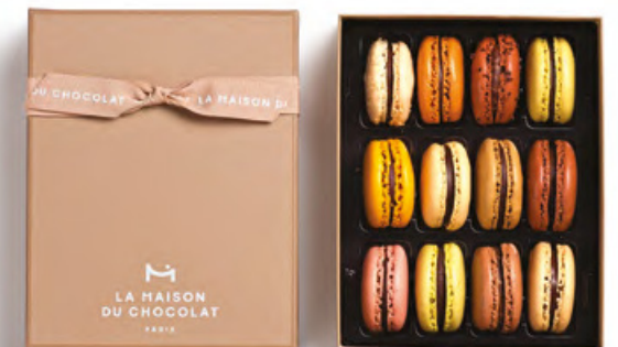
馬卡龍小圓餅禮盒12件