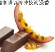
MARACUJA 熱情島 黑朱古力蓉 - 鮮熱情果汁及果肉