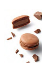
SYLVIA 牛奶朱古力 香甜幼滑牛奶朱古力蓉，帶淡淡焦糖香